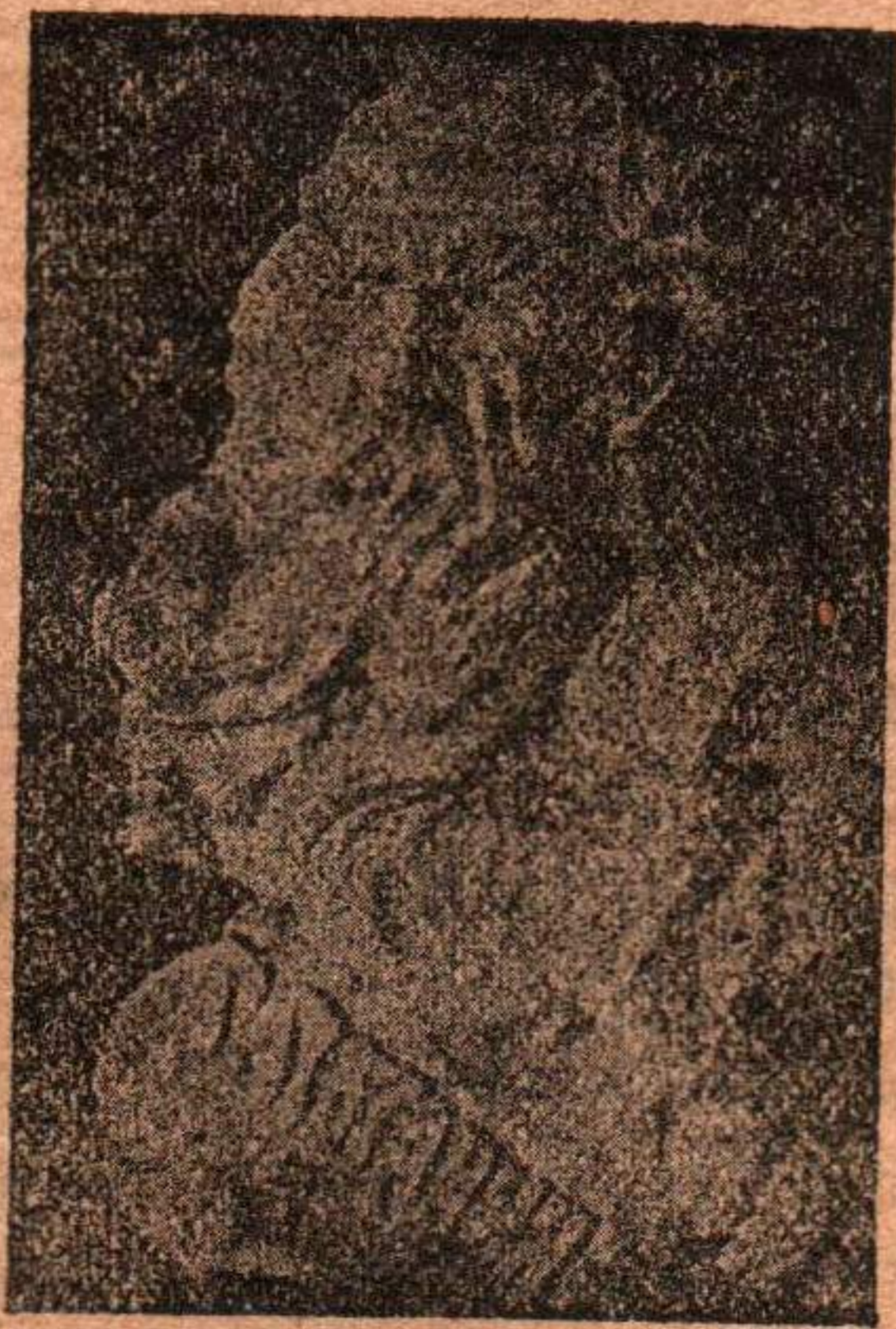
Григорій Николаевичъ Потанинъ.